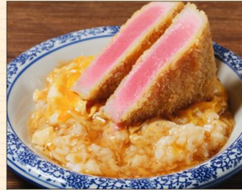
MAGURO KATSU DON 108 とじない鯖レアカツ丼 Thick Tuna Katsu & Egg on top of Rice