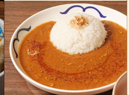
JYUKUSEI CURRY RICE 50 / 88 熟成カレーライス メの小盛り / 並盛り Secret Chef's Recipe Curry Rice. Choice of Small / Regular Size