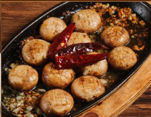
MUSHROOM GARLIC YAKI 48 鉄板 マッシュルームガーリック焼き Spanish Style Grilled Mushroom