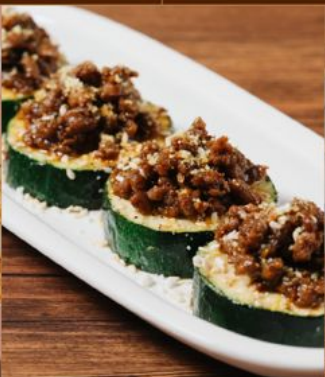
ZUCCHINI YAKI 55 ズッキーニ焼き Grilled Zucchini with Chopped Meat