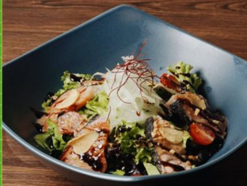
SALMON TATAKI SALAD 108 サーモンたたきサラダ Sliced Salmon, Mix Veggies & Truffle Onion