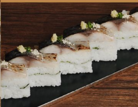
ABURI TORO SHIMESABA OSHI SUSHI 108 炙りトロしめ鯖押し寿司 Torched Marinated Mackerel Sushi