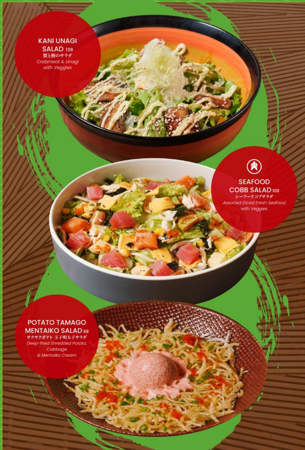
KANI UNAGI SALAD 138 蟹と鰻のサラダ Crabmeat & Unagi with Veggies