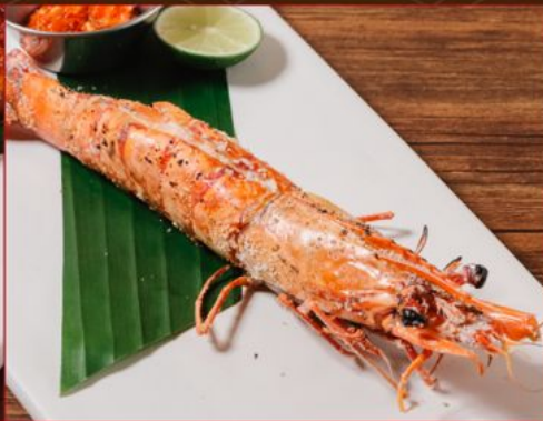
EBI YAKI 110 大海老焼き Grilled Prawn