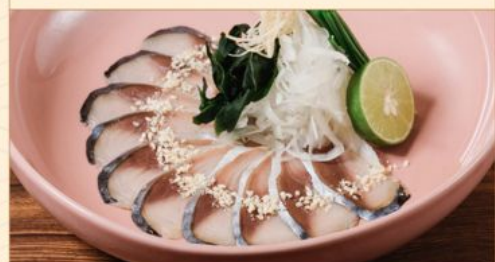
HAKATA GOMA SHIMESABA 88 博多風胡麻メサバ Marinated Mackerel with Sesame