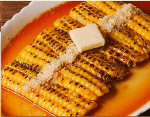
TOMOROKOSHI PARMESAN YAKI 58 とうもろこし パルメザンチーズ焼き Grilled Corn with Parmesan & Teriyaki Sauce