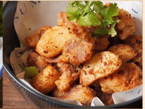
SUNAGIMO KOUJI AGE 68 コリコリ砂肝香味揚げ Fried Chicken Gizzard with Spicy Seasoning