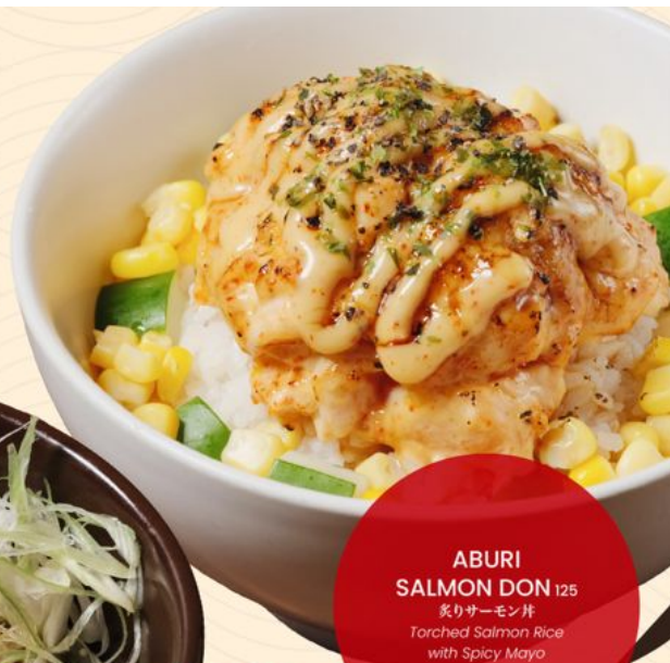
ABURI SALMON DON 125 炙りサーモン丼 Torched Salmon Rice with Spicy Mayo