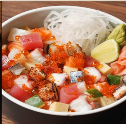
BARA CHIRASHI DON 138 ばらちらし丼 Mixed Diced Sashimi on Top of Rice