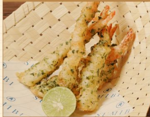
AONORI EBI TEMPURA 118 青のり海老天ふら Deep-fried Prawn with Seaweed