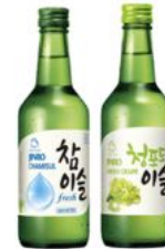
JINRO CHAMISUL ORIGINAL / GREEN GRAPE ジンロ チャミスル 180