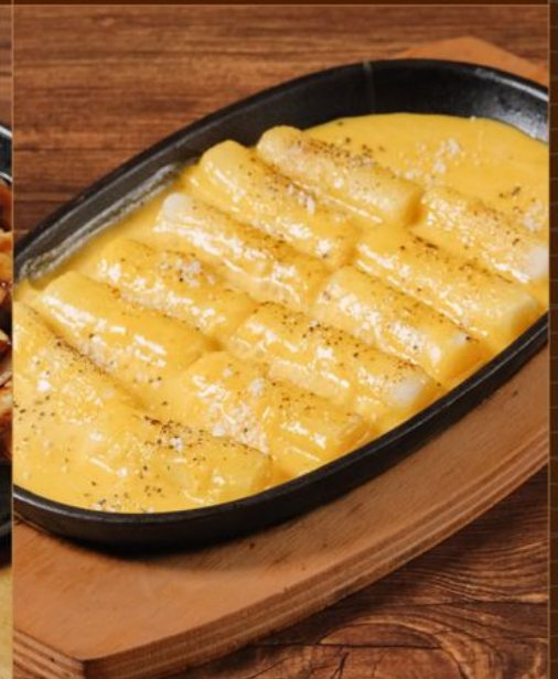
MOCHI CARBONARA 80 鉄板 餅カルボナーラ Ricecakes with Carbonara Sauce & Cheese