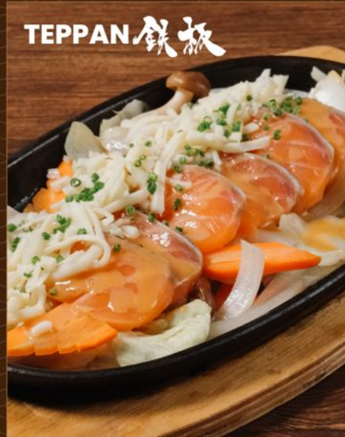
SALMON CHAN CHAN YAKI 148 鉄板 サーモンちゃんちゃん焼き Salmon Hotplate with Sweet Miso Sauce, Cheese & Cabbage