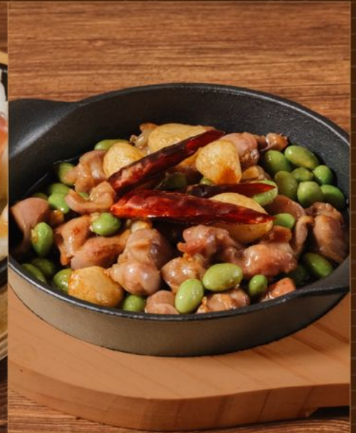
EDAMAME SUNAGIMO PEPERONCINO 78 鉄板 枝豆砂肝 ペペロンチーノ Gizzard & Edamame Hotplate