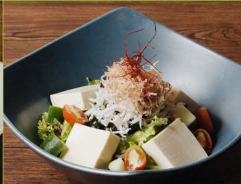
SHIRASU TOFU WAKAME SALAD 78 シラス豆腐わかめサラダ Dried Whitebait Fish & Tofu with Veggies