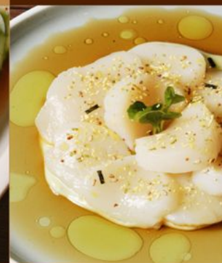
HOTATE CARPACCIO 108 北海道帆立カルパッチョ Sliced Hokkaido Scallop with Wasabi Cream