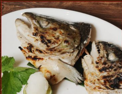
SALMON KAMA YAKI 138 サーモンかま焼き (照り焼き/味噌/スパイシーマヨ/タルタル/塩焼き) Grilled Salmon Head : Teriyaki / Miso / Spicy Mayo / Tartar / Salt