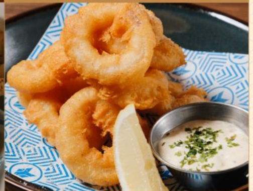
YARIIKA TEMPURA SANSHO SHIO 88 ヤリイカ天ぷら 山椒塩 Deep-Fried Squid with Tartar Sauce