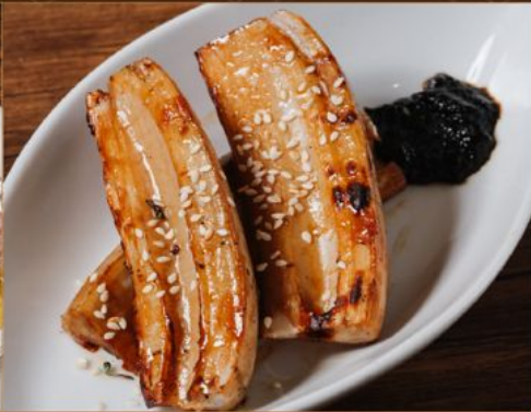
RENKON YAKI 58 レンコン焼き Grilled Lotus Root