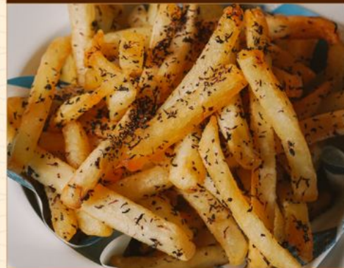
FRENCH FRIES 55 フレンチフライ 青のり/チーズ/塩 Seaweed / Parmesan Cheese / Salt