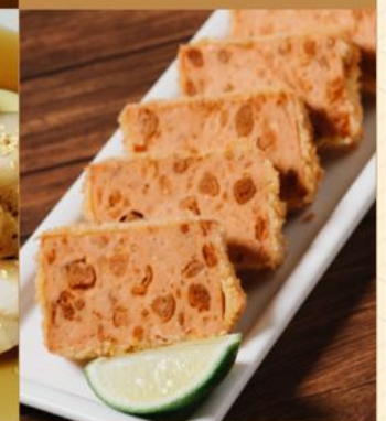
HEALTHY HAM KATSU 78 ヘルシー糖厚ハムカツ Deep Fried Vegan 'Ham'