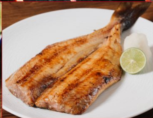
HOKKE YAKI 228 ホッケ焼き Grilled Atka Mackerel