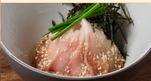
HAKATA GOMA HAMACHI 138 博多胡麻ハマチ Marinated Amberjack with Sesame