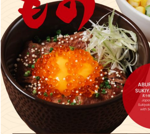
ABURI WAGYU SUKIYAKI DON 168 炙り和牛すき焼き丼 Japanese Wagyu Sukiyaki on top of Rice with Salmon Caviar