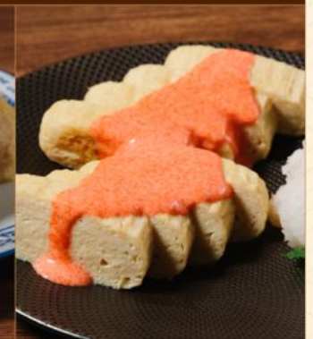
DASHIMAKI TAMAGO MENTAIKO 78 出汁巻き玉子明太子 Omelette with Mentaiko Cream