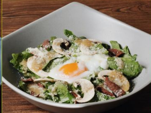
ONTAMA HORENSO SALAD 88 温玉ほうれん草サラダ Horensou, Mushrooms, Veggie with Egg & Parmezan