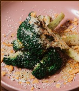
BROCCOLI YAKI 58 ブロッコリー焼 Grilled Broccoli