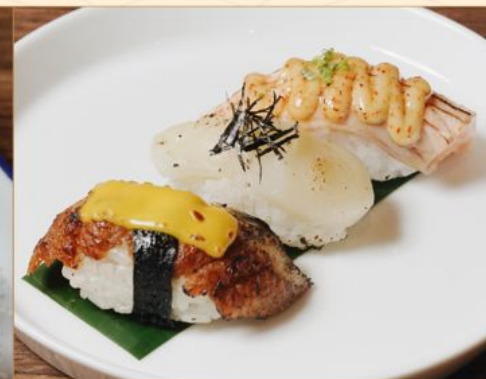
ABURI NIGIRI SUSHI 98 炙りにぎり寿司 3貫 Unagi Cheese, Scallop, Salmon & Spicy Mayo Nigiri