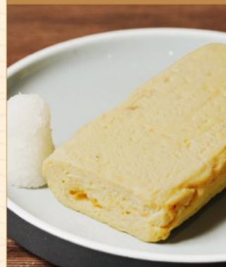
DASHIMAKI TAMAGO PLAIN 68 出汁巻き玉子 +10 for Additional Cheese Filling