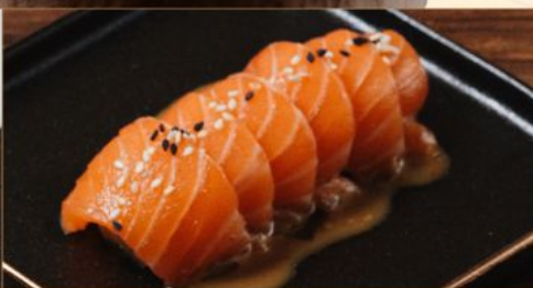
GOMA SALMON 88 胡麻サーモン Fresh Salmon with Sesame Sauce