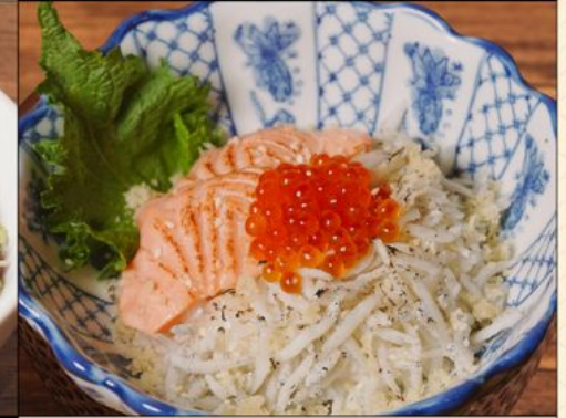
SHIRASU SALMON IKURA DON 98 釜揚げしらす サーモンいくら丼 小盛り Dried Fish, Salmon & Salmon Caviar on top of Rice