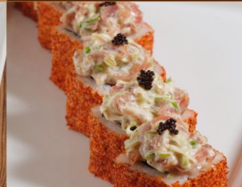
SPICY TUNA ROLL 95 スパイシーツナロール Spicy Tuna Roll with Shichimi & Tobiko