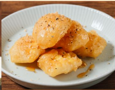
CARAMEL CORN 58 キャラメルコーン Deep Fried Battered Corn with Honey