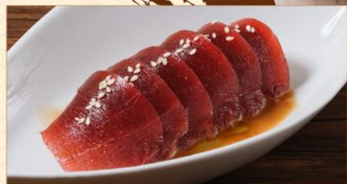
GOMA MAGURO 80 胡麻鮪 Fresh Tuna with Sesame Sauce