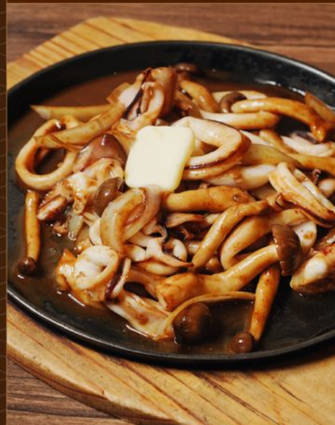
YARIKA MISO BUTTER 98 鉄板 ヤリイカ味噌バター Squid & Mushroom with Miso Butter