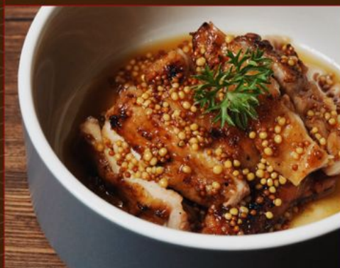
TORI HONEY MUSTARD YAKI 88 鶏ハニーマスタード焼き Grilled Chicken with Honey Mustard