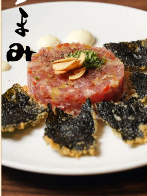
MAGURO TARTAR CANAPE 108 鮪タルタル海苔カナペ Chopped Tuna with Fried Seaweed