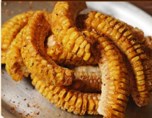
SPICY POPCORN 55 スパイシーポップコーン Deep-fried Corn with Spicy Seasoning