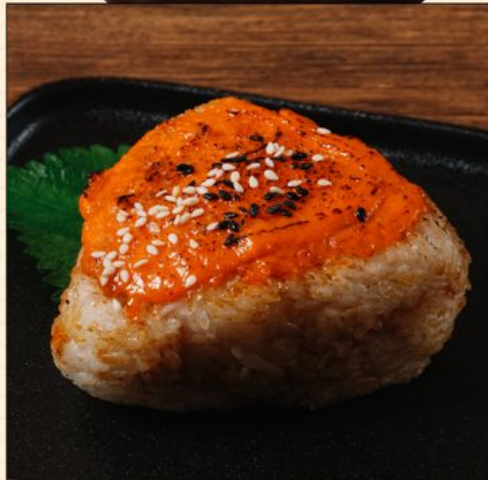
YAKI ONIGIRI 50 焼きおにぎり うに味噌/醤油/明太子 Grilled Rice Ball with Choice of Uni Miso / Shoyu / Mentaiko