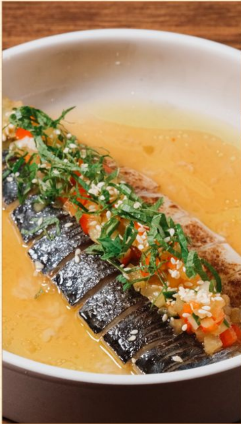
ABURI SHIMESABA TROPICAL PONZU 98 炙りメ鯖 トロピカルポン酢 Marinated Mackerel with Sweet Sour Sauce