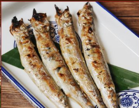
SHISHAMO YAKI 78 ししゃも焼き Grilled Shishamo with Shichimi Mayo