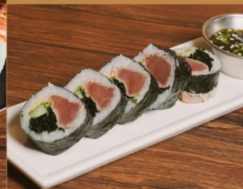
MAGURO TOSA ROLL 95 鮪の上佐ロール Tuna with Cucumber, Seaweed & Ponzu Dipping