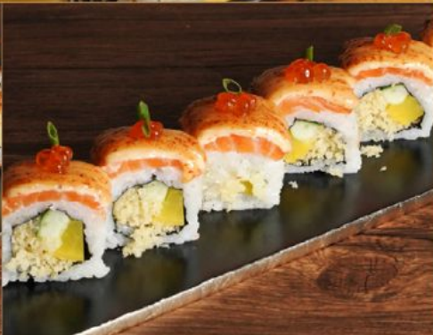
CRISPY SALMON ROLL 95 クリスピーサーモンロール Aburi Salmon Roll with Mayo & Salmon Roe