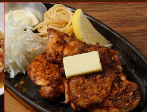
TORI MOMO KOUMI YAKI 88 鉄板鶏モモ香味焼き Grilled Chicken Steak with Spicy Savoury Sauce