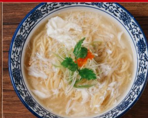
KANI ANKAKE MEN 108 蟹あんかけ麺 Ramen with Crabmeat & Thick Broth