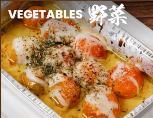
CHEESE TOMATO YAKI 68 チーズトマト焼き Grilled Tomatoes & Cheese