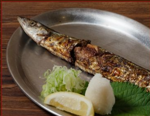
SANMA SHIO YAKI 138 秋刀魚塩焼き Salt-grilled Pacific Saury