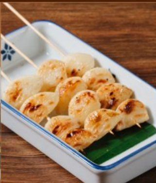
NINNIKU KUSHIYAKI 38 ニンニク串焼き Grilled Garlic Skewers