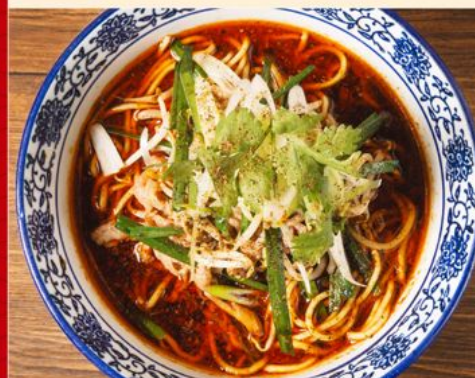
GYU MALA MEN 90 牛麻辣麺 Ramen with Sliced Beef & Spicy Mala Soup