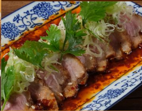
YODARE KAMO 148 よだれ鴨 Steamed Duck with Spicy Sauce