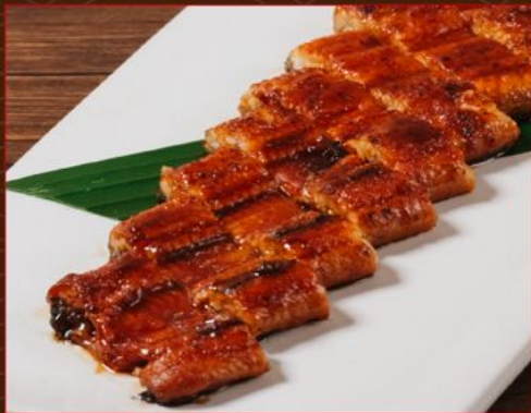
UNAGI KABAYAKI 248 うなぎ蒲焼き Grilled Whole Unagi *Good for Sharing*