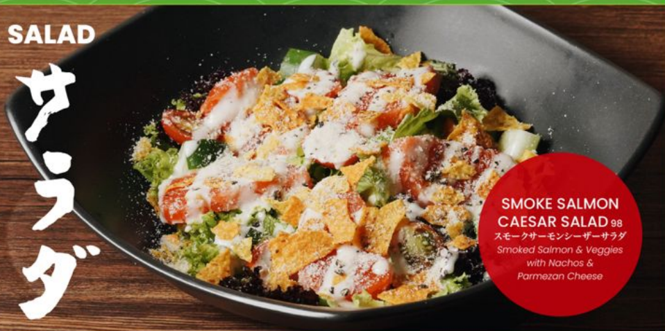
SMOKE SALMON CAESAR SALAD 98 スモークサーモンシーザーサラダ Smoked Salmon & Veggies with Nachos & Parmezan Cheese