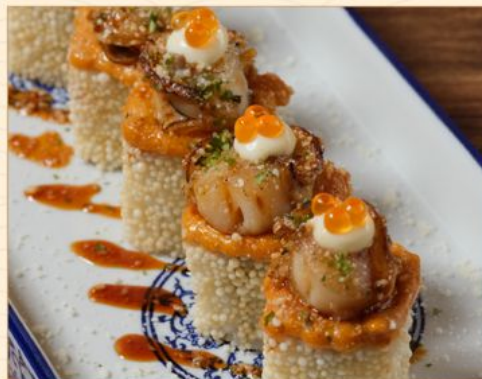
HOTATE ROLL 138 帆立ロール Torched Scallop Roll with Salmon Roe & Spicy Mayo