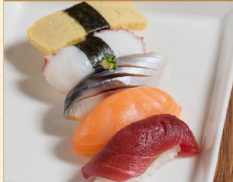
NIGIRI SUSHI GOKAN 138 にぎり寿司 5貫 Assorted Nigiri Sushi