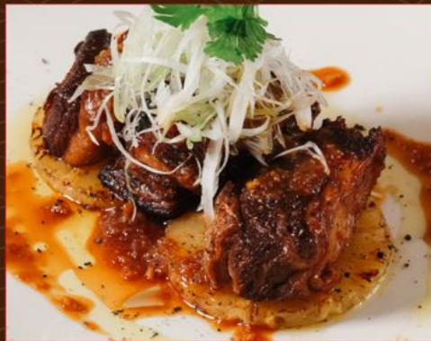
JAPANESE WAGYU ABURI KAKUNI 278 日本産和牛炙り角煮 バイナップルジンジャー Braised Tender Japanese Wagyu Beef Belly