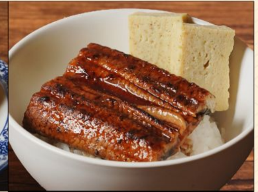
UNAGI DON 138 うなぎ丼 Grilled Unagi & Egg on top of Rice