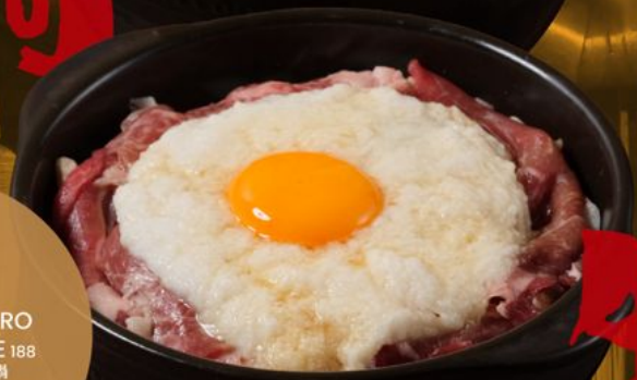
\ 1-2 PERSON / WAGYU TORORO SUKIYAKI NABE 188 和牛とろみすき焼き鍋 Japanese Beef and Egg with Sukiyaki Soup