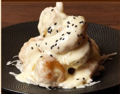
HOTATE EBI YUZU MAYO 148 帆立と海老の柚子マヨ Fried Scallops & Shrimp with Golden Mayo Sauce