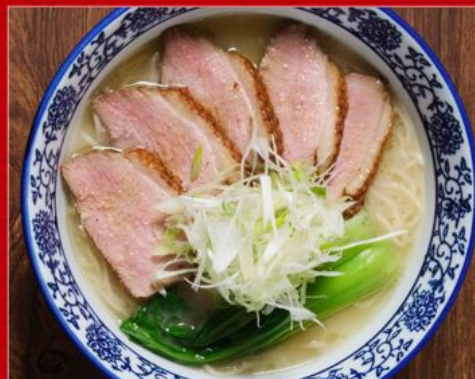
KAMO PAITAN RAMEN 98 濃厚鴨白湯ラーメン Ramen with Sliced Duck Meat & Bone Broth