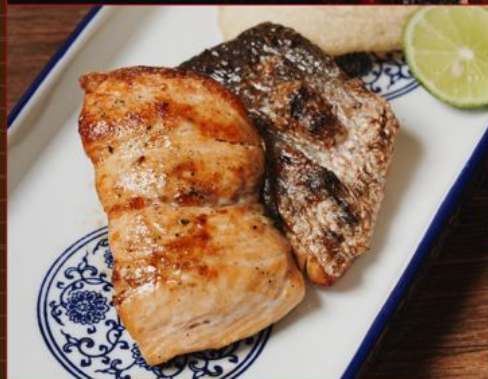
SALMON SUMI YAKI 138 サーモン炭焼き 照り焼き/味噌/スパイシーマヨ/タルタル/塩焼き Grilled Salmon : Teriyaki / Miso / Spicy Mayo / Tartar / Salt