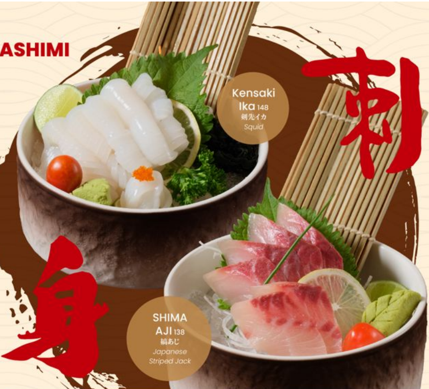
Kensaki Ika 148 刺先イカ Squid