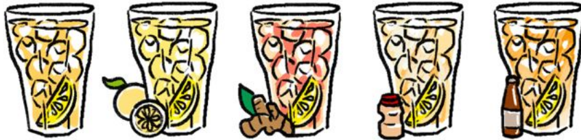
HIGH BALL ハイボール 78 / 130 / 185 S D T