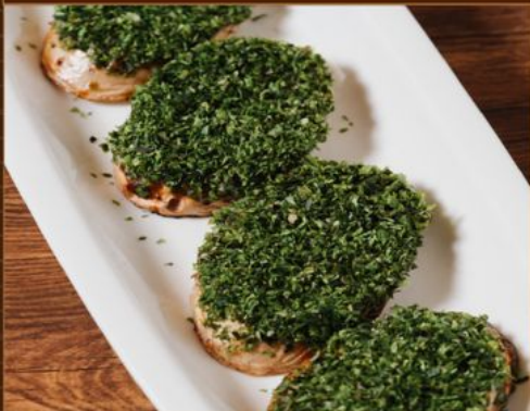
NAGAIMO OTAFUKU YAKI 55 長芋お多福焼き Grilled Yam