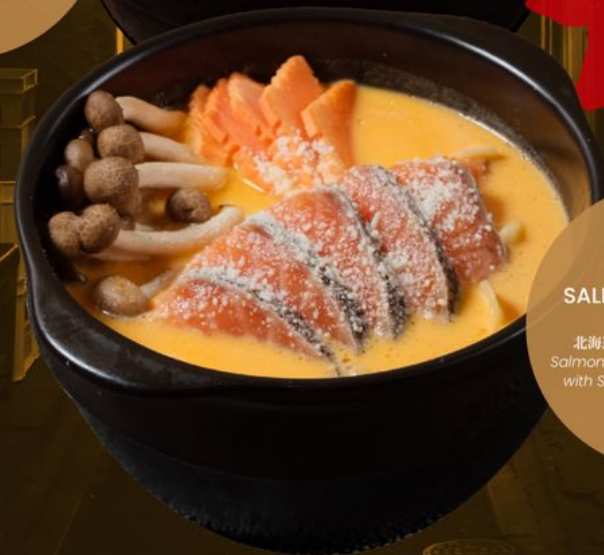
\ 1-2 PERSON / SALMON UNI CREAM NABE 188 北海道サーモン うにクリーム鍋 Salmon, Mushroom & Vegetables with Sea Urchin Creamy Soup