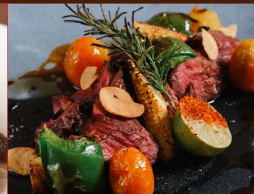
GYU HARAMI GARLIC STEAK 198 牛ハラミガーリックステーキ Skirt Beef Steak with Garlic, Potato & Corn