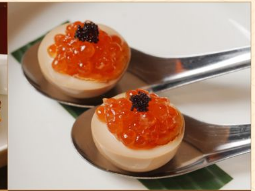
IKURA TAMAGO SPOON 98 いくら玉子スプーン 2 Pcs Egg with Salmon Roe