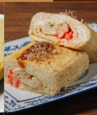
DASHIMAKI TAKOYAKI 78 出汁巻きたこ焼き Omelette with Octopus & Katsuobashi