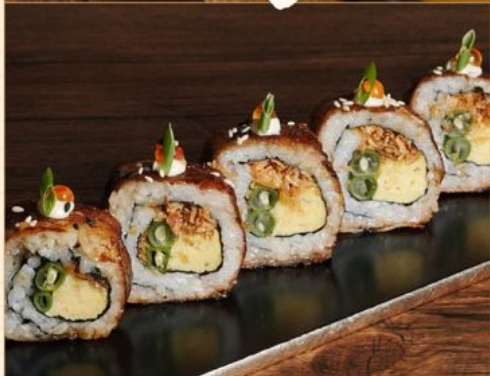
BEEF SUKIYAKI ROLL 95 牛すき焼きロール Marinated Beef Roll with Egg