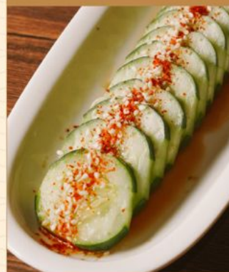
YAMITSUKI KYURI 50 やみつき胡瓜 Marinated Cucumber Slices