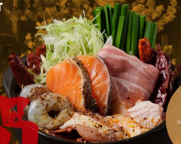
\ 1-2 PERSON / MALA NABE 188 大人の麻辣火鍋 Salmon, Beef, Shrimp, Chicken & Chinese Chives with Spicy Mala Soup