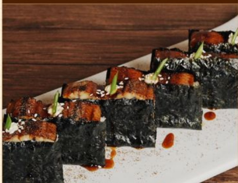
UNAGI OSHI SUSHI 228 うなぎ押し寿司 Grilled Unagi Sushi