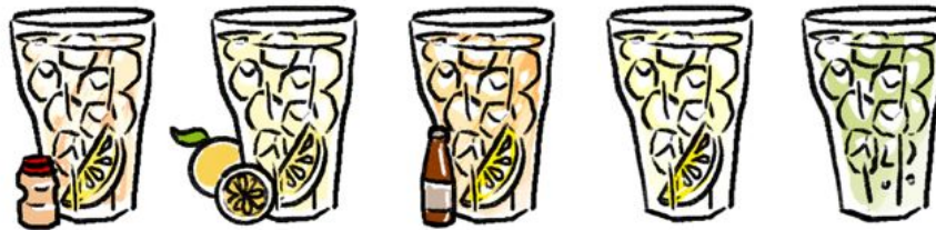
YAKULT SOUR ヤクルトサワー 68