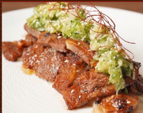
NEGISHIO KALBI YAKI 150 葱塩カルビ焼き Beef Kalbi with Marinated Onion