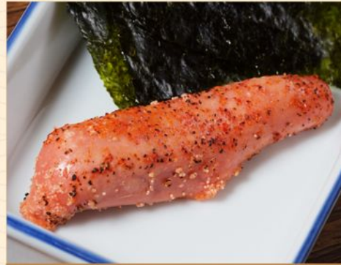
ABURI MARUGOTO MENTAIKO 88 炙りまるごと明太子 Grilled Spicy Cod Roe