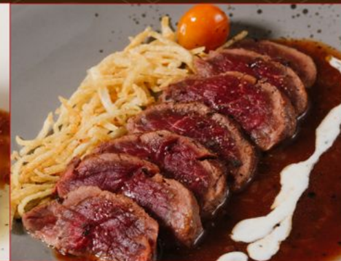
GYU HIRE STEAK 228 牛ヒレステーキ デミグラスソース Beef Tenderloin Steak with Demi Glace Sauce