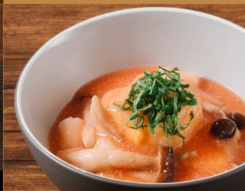
AGEDASHI TOFU MENTAICO SAUCE 80 揚げ出汁豆腐明太子ソース Fried Tofu with Spicy Cod Roe Sauce & Mushroom