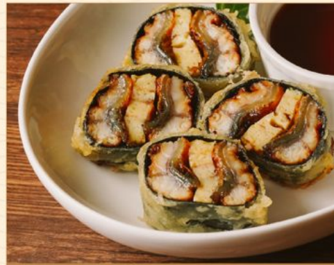
UNAGI HASAMI AGE 138 うなぎ挟み揚げ Deep-fried Unagi Rolls