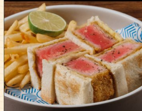
MAGURO KATSU SANDWICH 95 まぐろカツサンド Thick Tuna Katsu Sandwich with Double Sauce