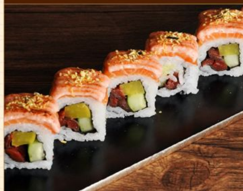
SALMON MENTAIKO ROLL 95 サーモン明太子ロール Salmon Roll with Mentaiko & Pickles