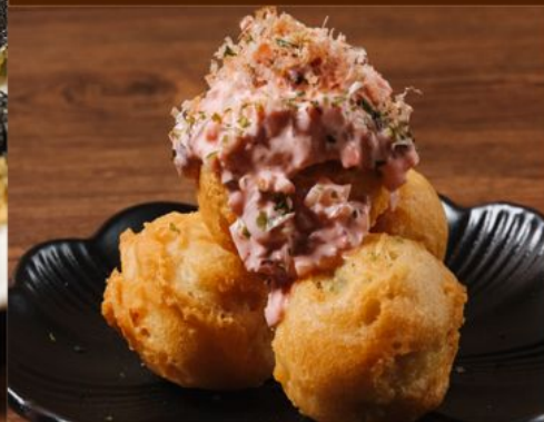
TAKOYAKI TEMPURA SHIBAZUKE TARTAR 68 たこ焼き天ぷらしば漬けタルタル Deep-fried Octopus Ball with Pickles Tartar