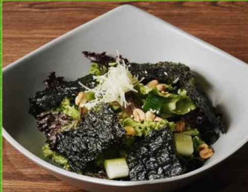
CHOREGI SALAD 78 チョレギサラダ Korean Seaweed, Cucumber with Mix Veggies