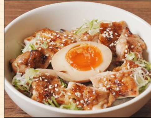
YAKITORI DON 80 焼鳥丼 Grilled Chicken on Top of Rice