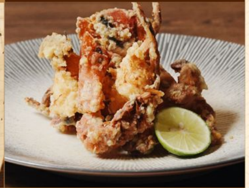
SOFTSHELL CRAB KARAAGE 98 ソフトシェルクラブ唐揚げ Deep-fried Battered Softshell Crab