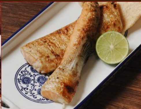
SALMON HARASU YAKI 128 サーモンハラス焼き 照り焼き/味噌/スパイシーマヨ/タルタル/塩焼き Grilled Salmon Belly : Teriyaki / Miso / Spicy Mayo / Tartar / Salt