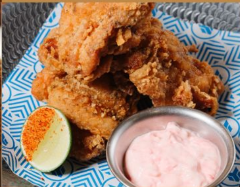
TORI KARAAGE 78 紅生姜 / オリジナル / 葱だくこぼし / スパイシーマヨ Beni Shoga / Original / Negidaku / Spicy Mayo