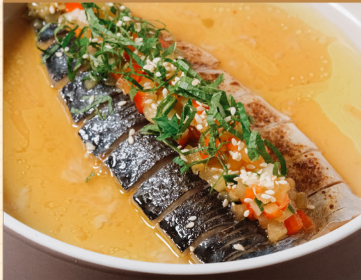
ABURI SHIMESABA TROPICAL PONZU 98 炙りメ鯛 トロピカルポン酢 Marinated Mackerel with Sweet Sour Sauce