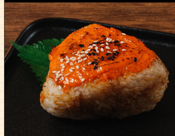
YAKI ONIGIRI 50 焼きおにぎり うに味噌、醤油、明太子 Grilled Rice Ball with Choice of Uni Miso / Shoyu / Mentaiko