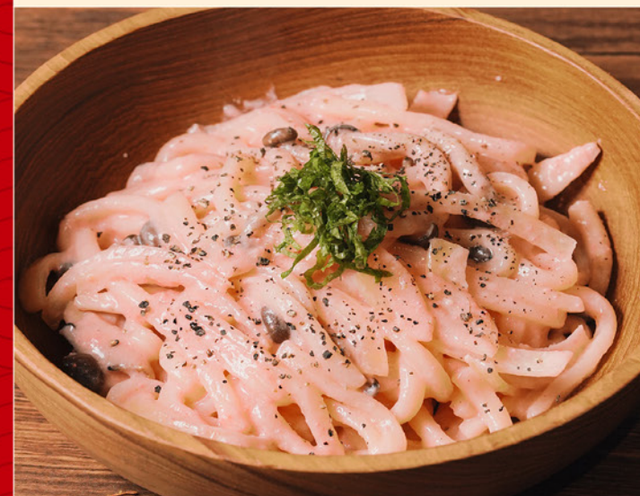
SALMON MENTAICO CREAM UDON 118 サーモン明太子クリームうどん Udon with Salmon & Mentaiko Cream