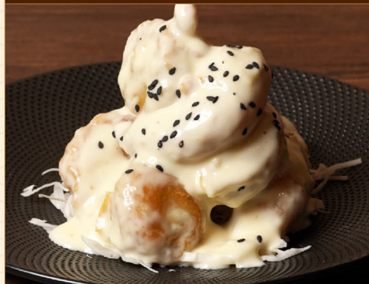
HOTATE EBI YUZU MAYO 148 帆立と海老の柚子マヨ Fried Scallops & Shrimp with Golden Mayo Sauce