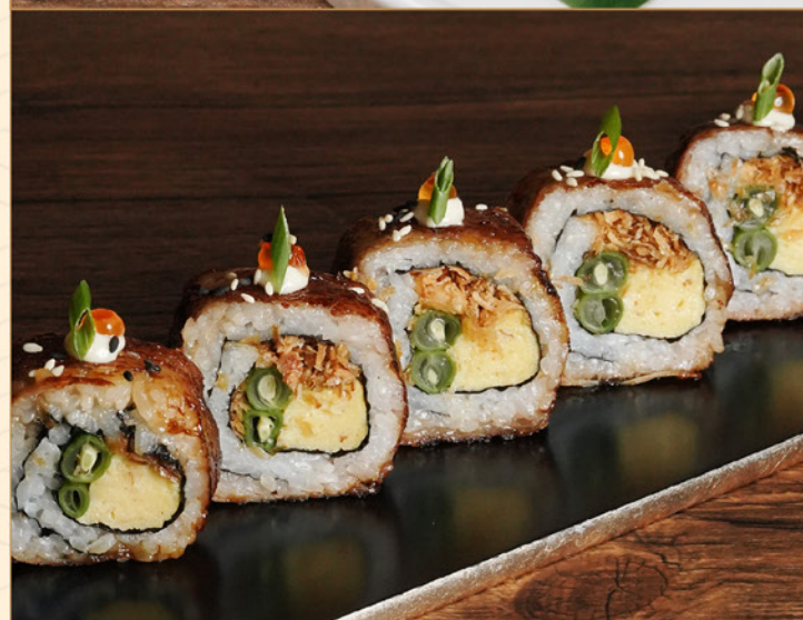
BEEF SUKIYAKI ROLL 95 牛すき焼きロール Marinated beef Roll with Egg