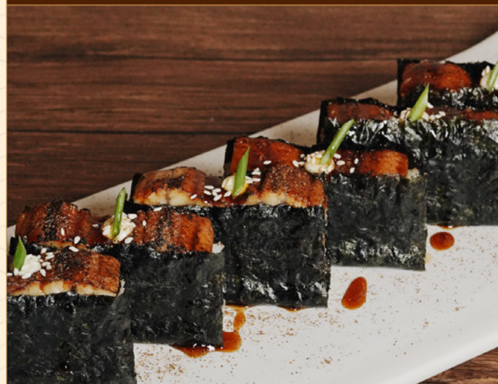
UNAGI OSHI SUSHI 228 うなぎ押し寿司 Grilled Unagi Sushi