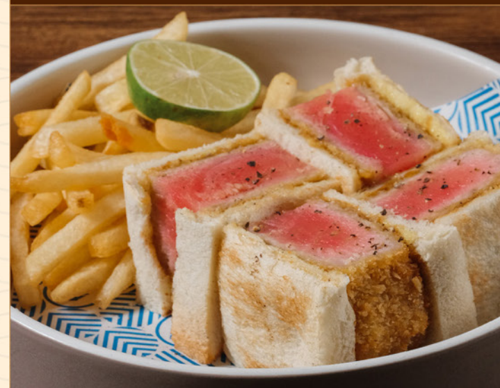
MAGURO KATSU SANDWICH 95 まぐろカツサンド Thick Tuna Katsu Sandwich with Double Sauce