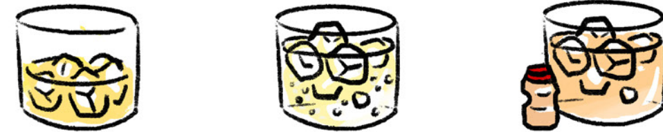
PLUM WINE ON THE ROCK 梅酒オンザロック 85