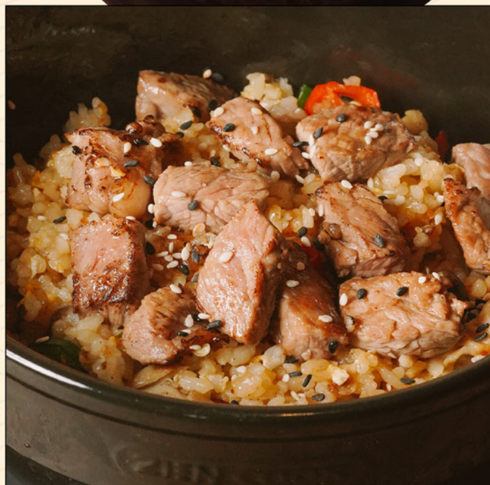
BEEF PEPPER RICE 118 石焼きビーフペッパーライス Pepper Rice with Diced Beef & Garlic