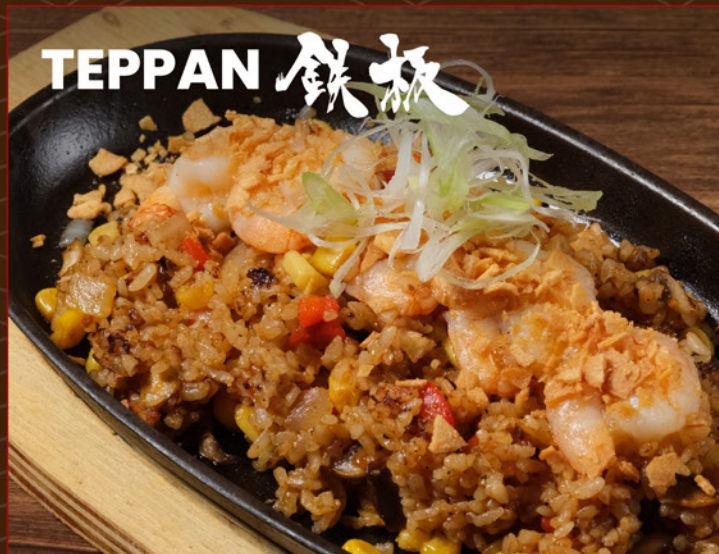
EBI MUSHROOM RICE 118 鉄板 海老マッシュルームライス Hotplate Rice with Prawn & Mushroom