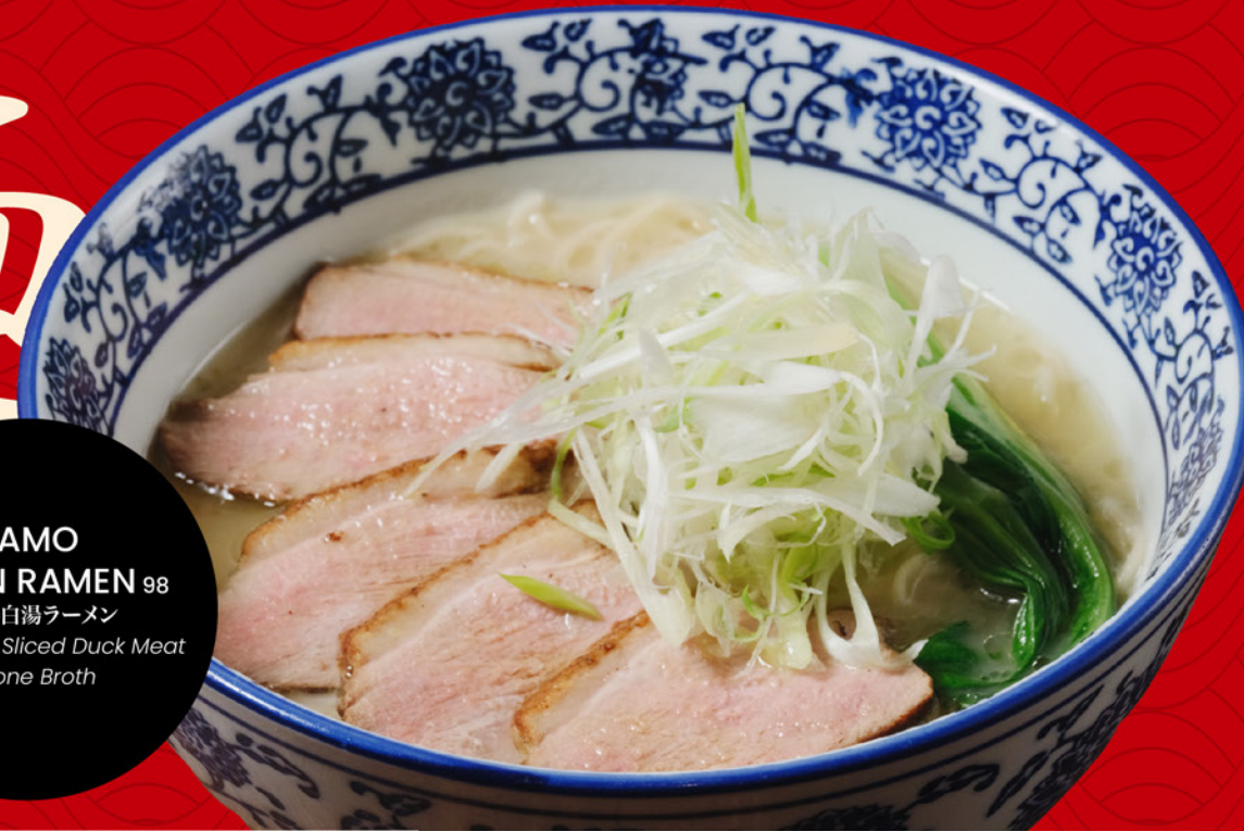
KAMO PAITAN RAMEN 98 濃厚鴨白湯ラーメン Ramen with Sliced Duck Meat & Bone Broth