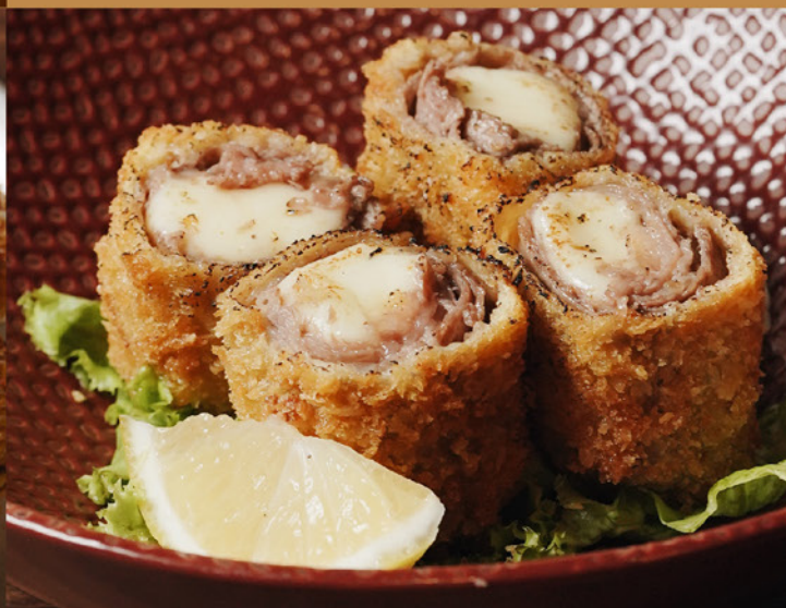
BEEF KATSU MOZZARELLA CHEESE 98 ビーフカツモzzarellaチーズ Deep-fried Beef Katsu Roll with Mozzarella