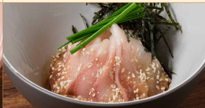
HAKATA GOMA HAMACHI 138 博多胡麻ハマチ Marinated Amberjack with Sesame