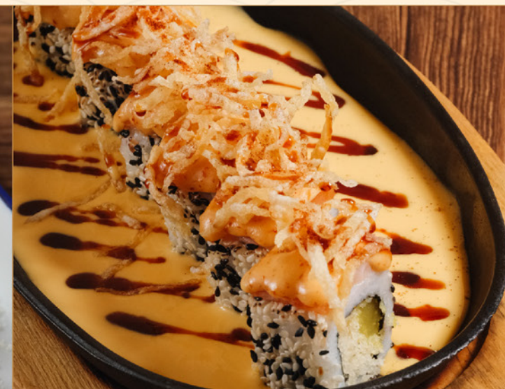
TEPPAN SALMON CHEESE ROLL 135 鉄板 サーモンチーズロール Aburi Salmon Roll with Cheese Sauce on Hotplate