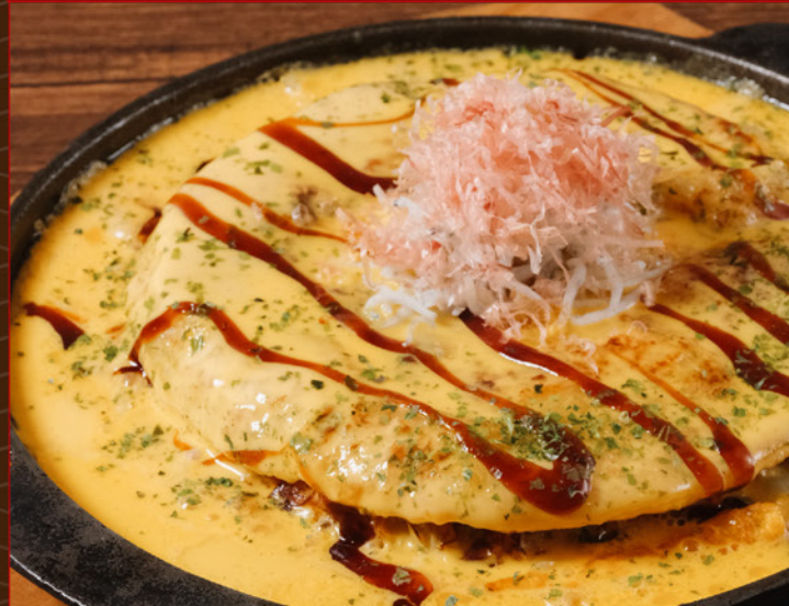
SHIRASU CHEESE OKONOMIYAKI 98 鉄板 しらすチーズ お好み焼き Japanese Omelette with Dried Fish & Cheese