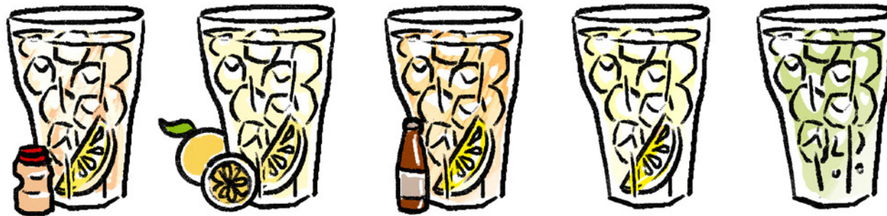
YAKULT SOUR ヤクルトサワー 68