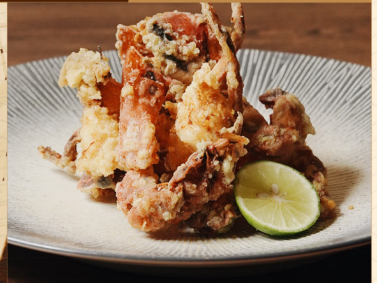
SOFTSHELL CRAB KARAAGE 90 ソフトシェルクラブ唐揚げ Deep-fried Battered Softshell Crab