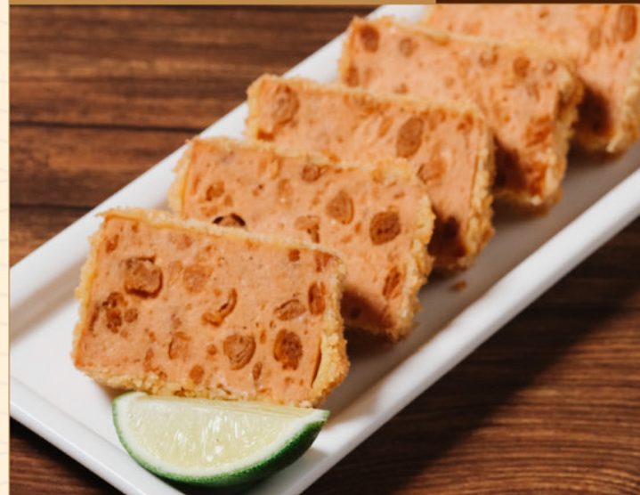
HEALTHY HAM KATSU 78 ヘルシー極厚ハムカツ Deep Fried Vegan 'Ham'