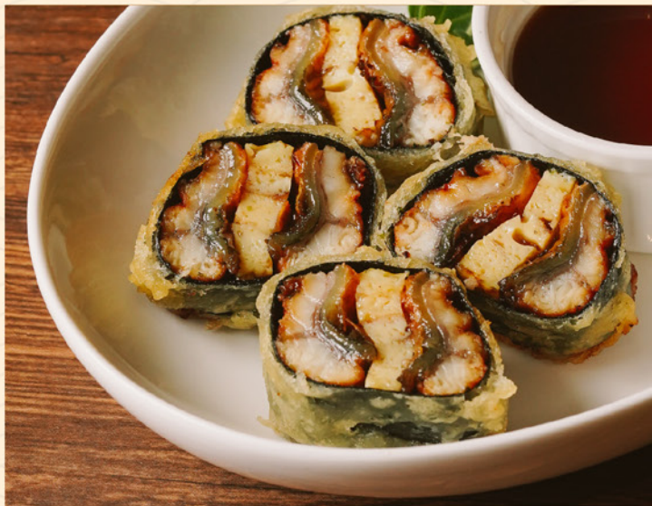
UNAGI HASAMI AGE 138 うなぎの挟み揚げ Deep-fried Unagi Rolls