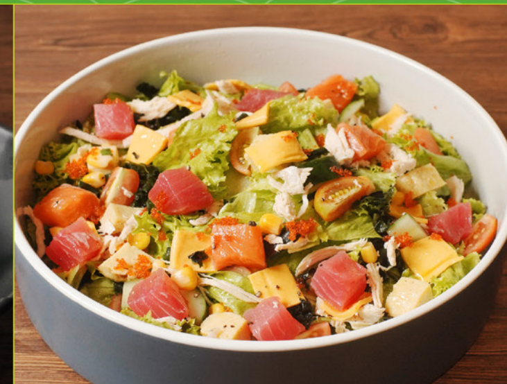
SEAFOOD COBB SALAD 108 シーフードコブサラダ Assorted Diced Fresh Seafood with Veggies