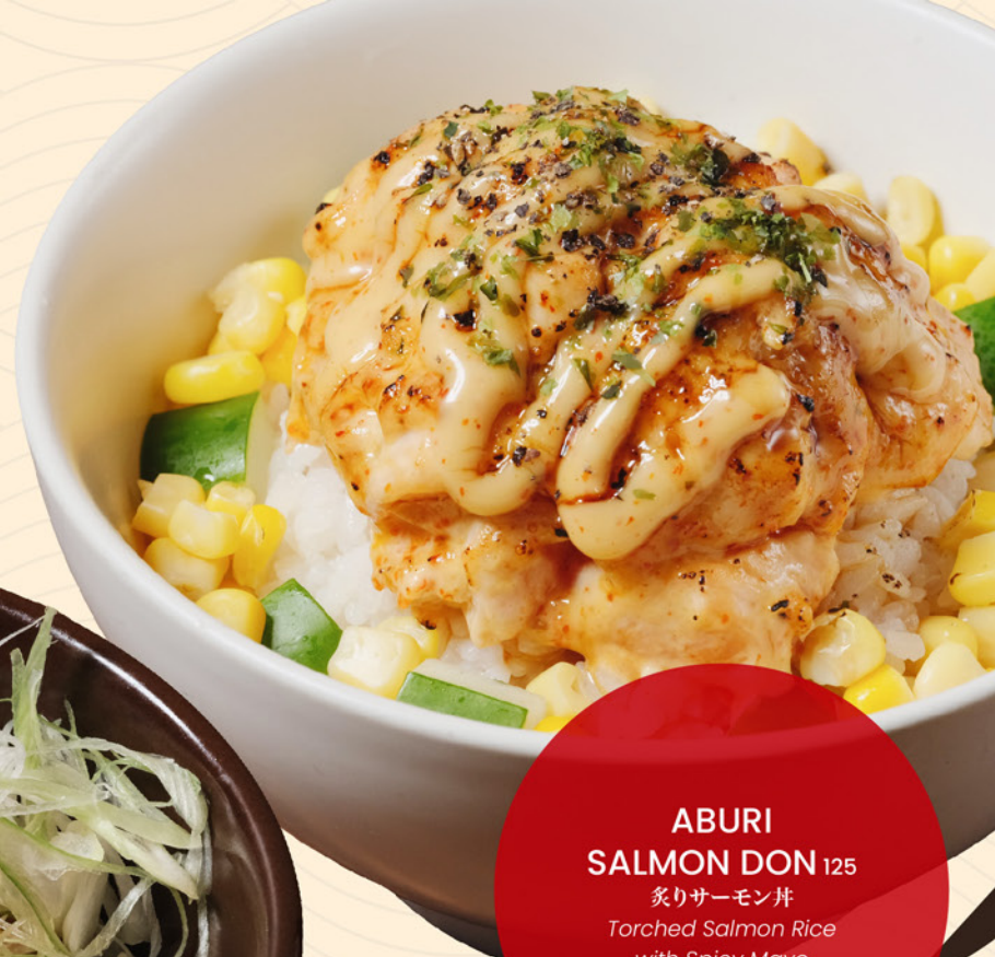
ABURI SALMON DON 125 炙りサーモン丼 Torched Salmon Rice with Spicy Mayo