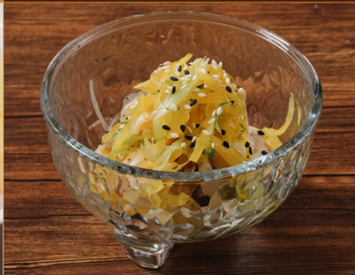
HOKKAIDO HOTATE NEGI AE 128 北海道帆立の葱和え Chopped Hokkaido Scallop with Scallions