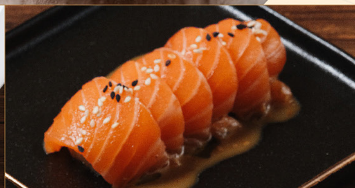
GOMA SALMON 75 胡麻サーモン Fresh Salmon with Sesame Sauce