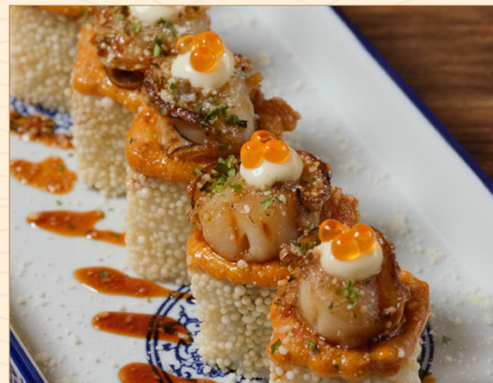
HOTATE ROLL 138 帆立ロール Torched Scallop Roll with Salmon Roe & Spicy Mayo