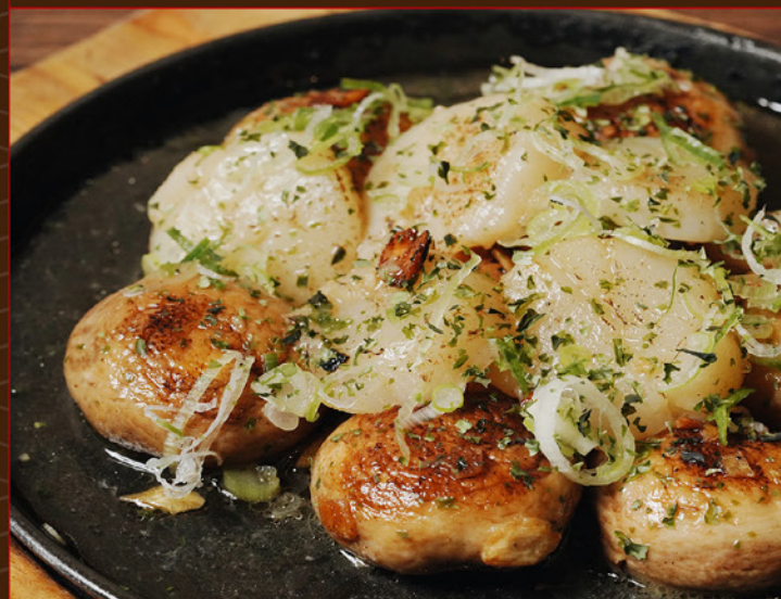
HOTATE BUTTER SHOYU 128 鉄板 帆立バター醤油 Scallop & Eringi Mushroom with Soy Butter