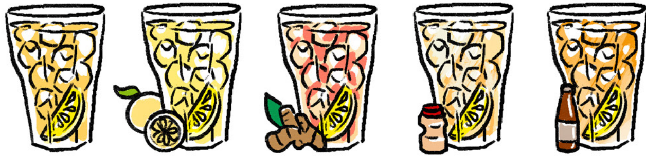
HIGH BALL ハイボール 75 / 130 / 185 S D T