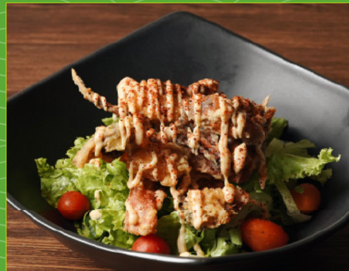
SOFTSHELL CRAB SALAD 98 ソフトシェルクラブサラダ Deep-fried Softshell Crab with Mixed Veggies