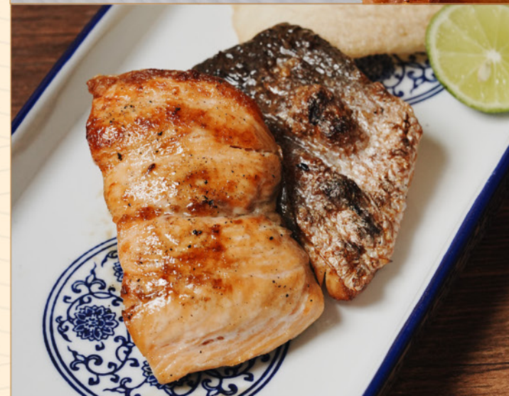
SALMON TERIYAKI/SPICY MAYO YAKI 128 サーモン 照り焼き/スパイシーマヨ焼き Grilled Salmon with Choice of Teriyaki or Spicy Mayo