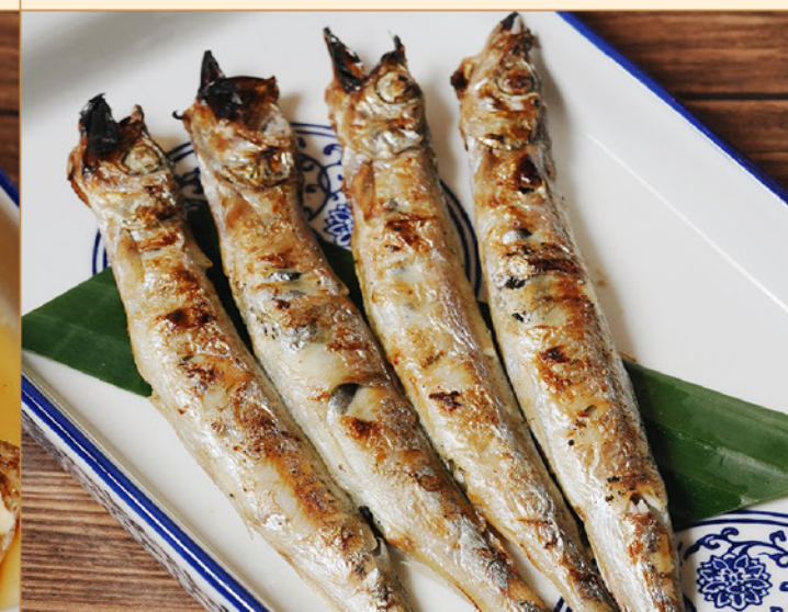
SHISHAMO YAKI 78 ししゃも焼き Grilled Shishamo with Shichimi Mayo