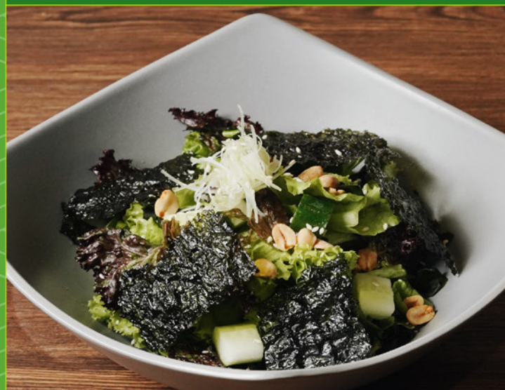
CHOREGI SALAD 78 チョレギサラダ Korean Seaweed, Cucumber with Mix Veggies