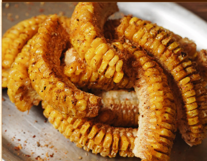
SPICY POPCORN 55 スパイシーポップコーン Deep-fried Corn with Spicy Seasoning