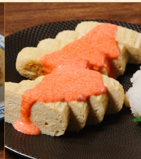
DASHIMAKI TAMAGO MENTAICO 78 出汁巻き玉子明太子 Omelette with Mentaiko Cream