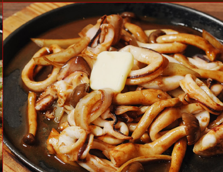
YARIIKA MISO BUTTER 98 鉄板 ヤリイカ 味噌バター Squid & Mushroom with Miso Butter