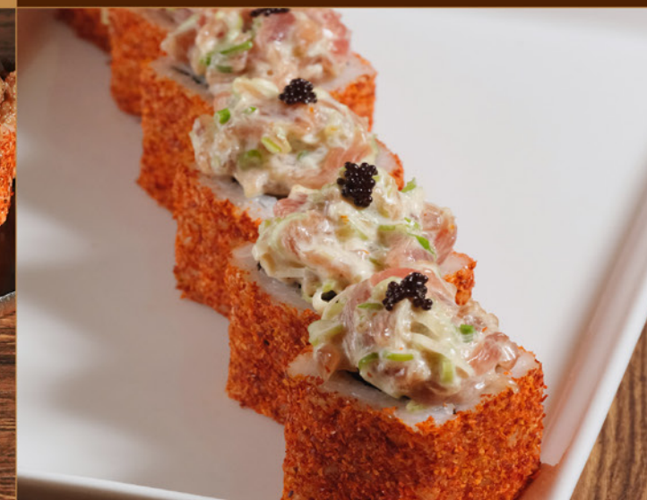
SPICY TUNA ROLL 95 スパイシーツナロール Spicy Tuna Roll with Shichimi & Tobiko