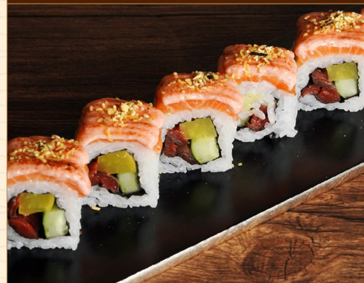
SALMON MENTAICO ROLL 95 サーモン明太子ロール Salmon Roll with Mentaiko & Pickles