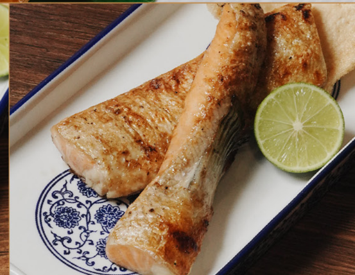
SALMON HARASU YAKI 128 サーモンハラス焼き Grilled Salmon Belly