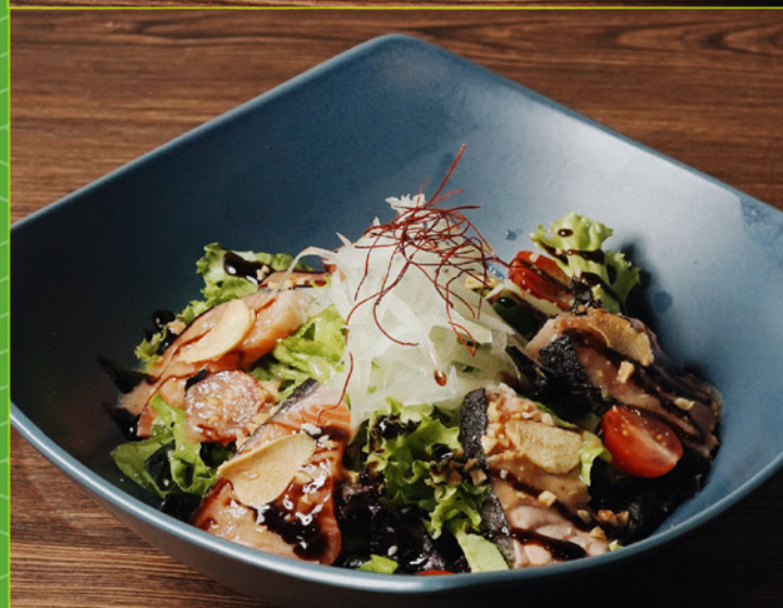
SALMON TATAKI SALAD 108 サーモンたたきサラダ Sliced Salmon, Mix Veggies & Truffle Onion