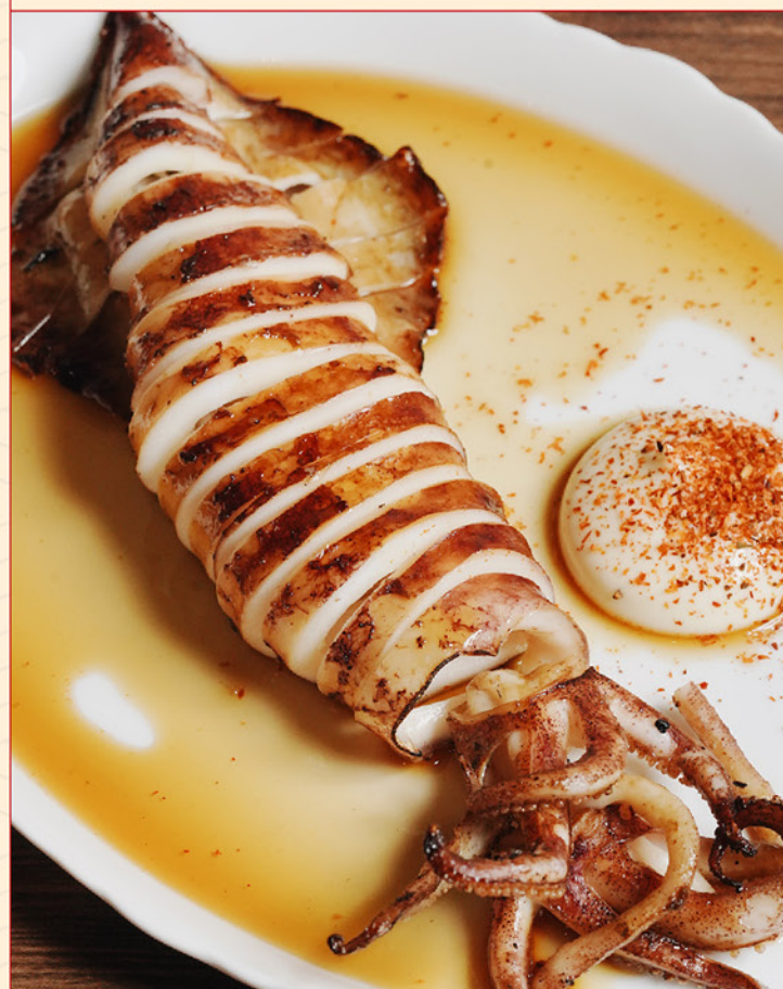
IKA MARUYAKI 90 イカ丸焼き Grilled Whole Squid with Shichimi Mayo