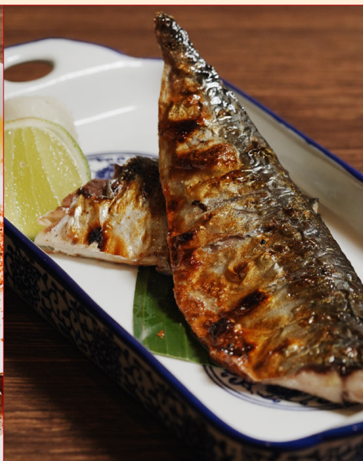
SABA SHIOYAKI/TERIYAKI 108 鯖塩焼き/鯖照り焼き Grilled Mackerel with choice of Teriyaki or Salt