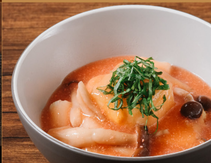
AGEDASHI TOFU MENTAICO SAUCE 80 揚げ出汁豆腐 明太子ソース Fried Tofu with Spicy Cod Roe Sauce & Mushroom