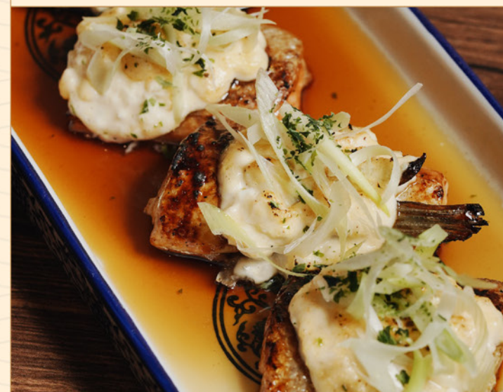
SALMON HARASU TARTAR YAKI 138 サーモンハラス タルタル焼き Grilled Salmon Belly with Tartar & Teriyaki