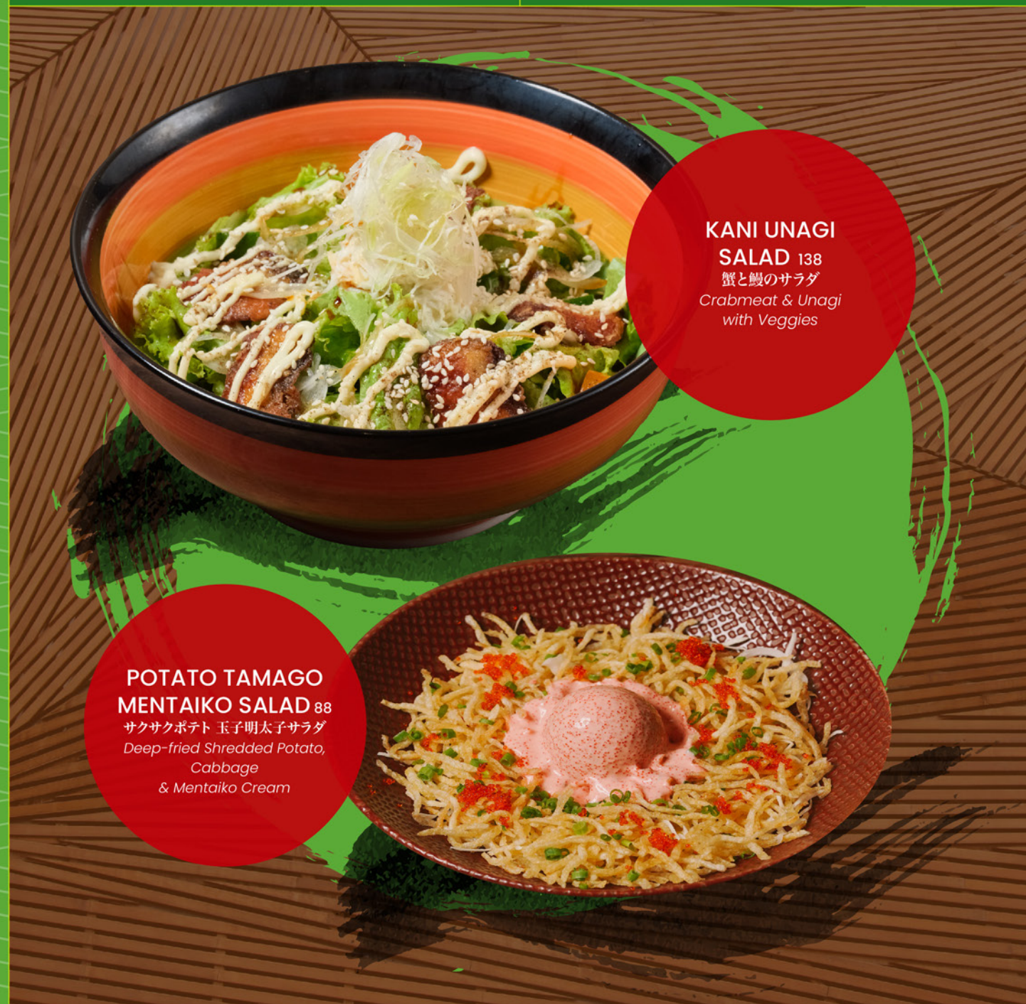
KANI UNAGI SALAD 138 蟹と鰻のサラダ Crabmeat & Unagi with Veggies