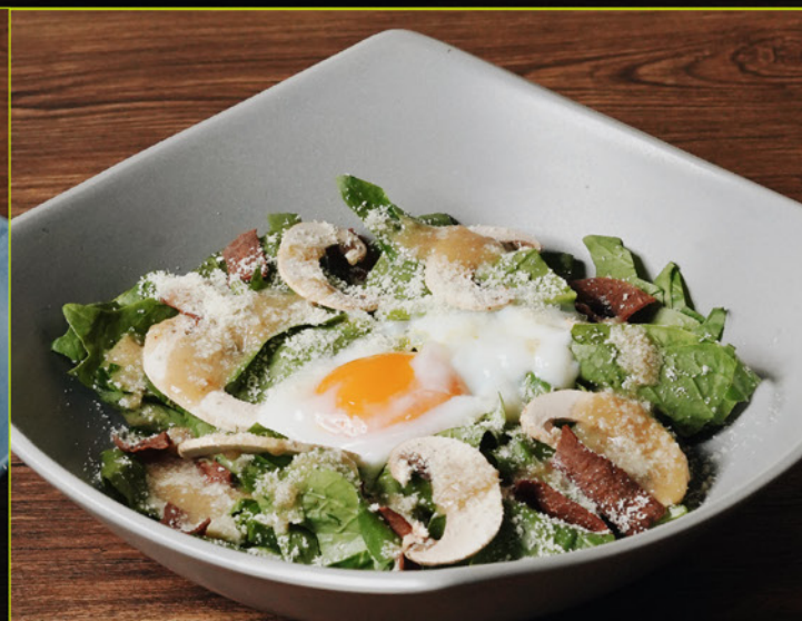
ONTAMA HORENSO SALAD 88 温玉ほうれん草サラダ Horens, Mushrooms, Veggie with Egg & Parmezan