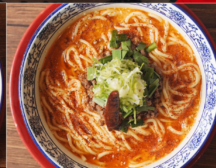
TANTAN MEN 88 担々麺 Ramen with Spicy Sesame Soup