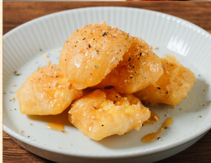
CARAMEL CORN 58 キャラメルコーン Deep Fried Battered Corn with Honey