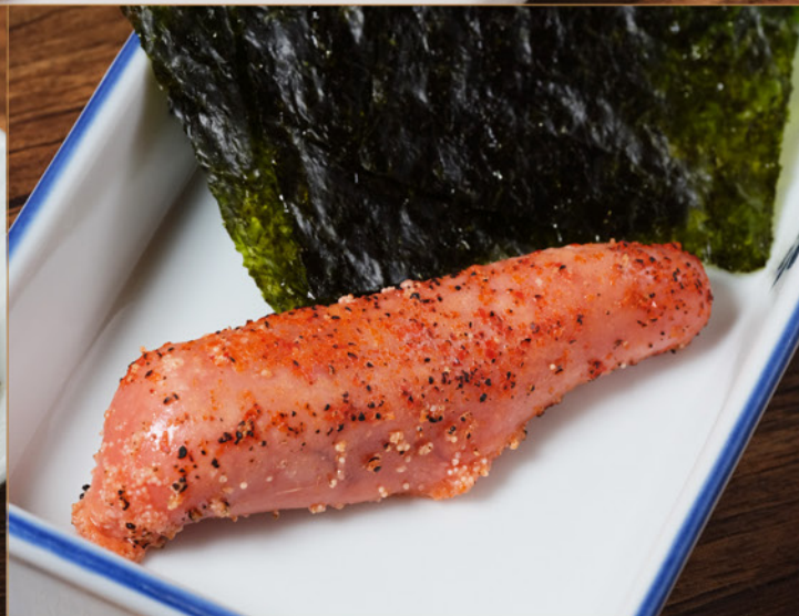
ABURI MARUGOTO MENTAICO 88 炙りまるごと明太子 Grilled Spicy Cod Roe