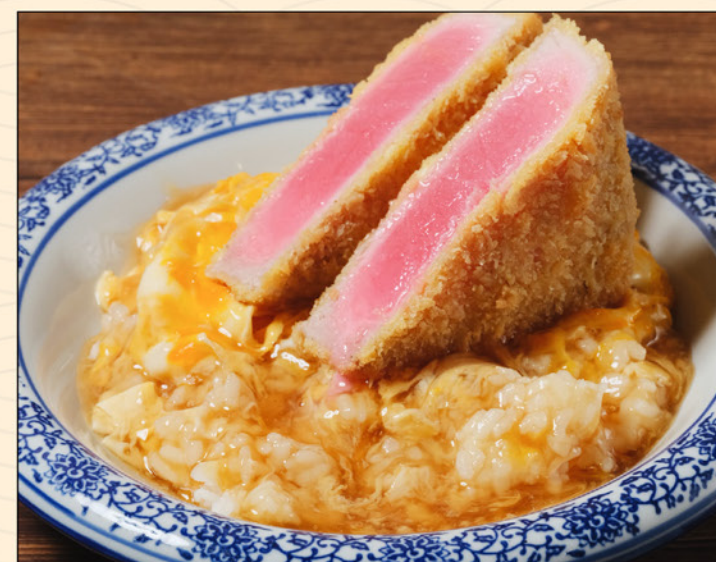
MAGURO KATSU DON 108 とじない鮪 レアカツ丼 Thick Tuna Katsu & Egg on top of Rice