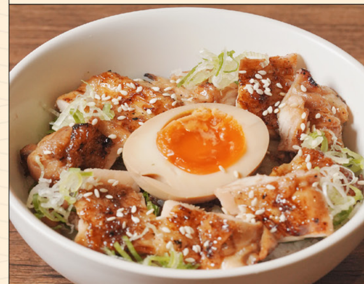
YAKITORI DON 88 焼鳥丼 Grilled Chicken on Top of Rice