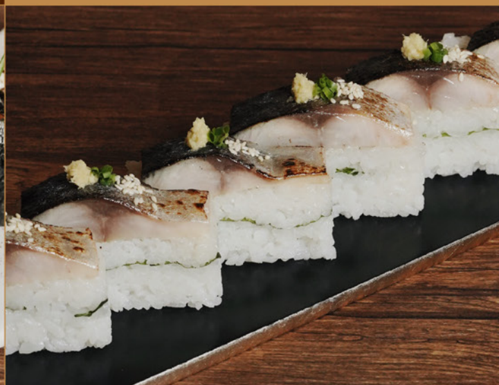
ABURI TORO SHIMESABA OSHI SUSHI 108 炙りトロしめ鯖押し寿司 Torched Marinated Mackerel Sushi