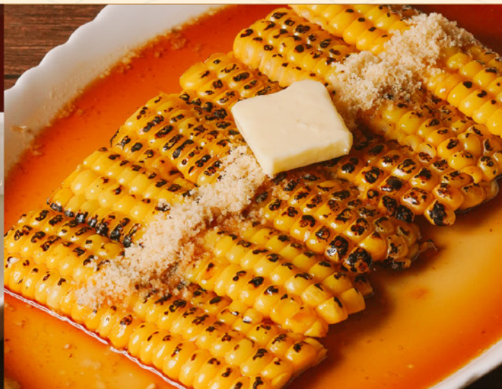
TOMOROKOSHI PARMESAN CHEESE YAKI 58 とうもろこし パルメザンチーズ焼き Grilled Corn with Parmesan & Teriyaki Sauce