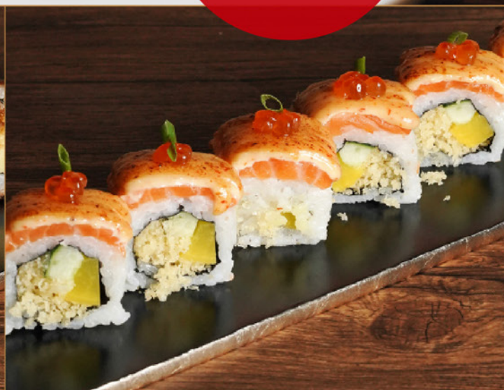
CRISPY SALMON ROLL 95 クリスピーサーモンロール Aburi Salmon Roll with Mayo & Salmon Roe