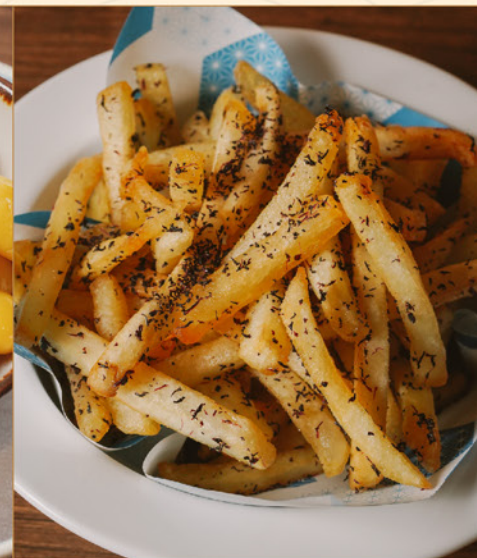
FRENCH FRIES 55 フライドポテト 海苔/チーズ/塩 Seaweed / Parmesan Cheese / Salt