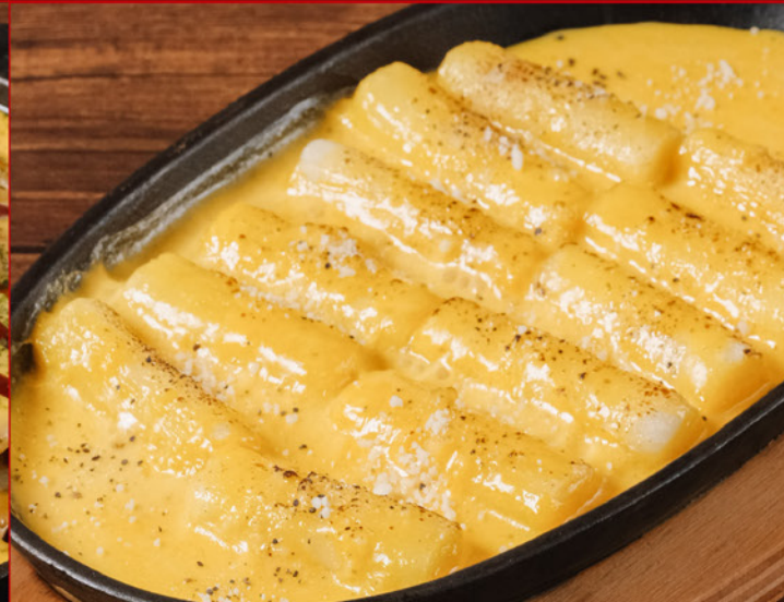
MOCHI CARBONARA 80 鉄板 餅カルボナーラ Ricecakes with Carbonara Sauce & Cheese