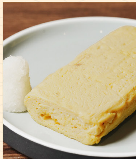
DASHIMAKI TAMAGO PLAIN 68 出汁巻き玉子 +10 for Additional Cheese Filling