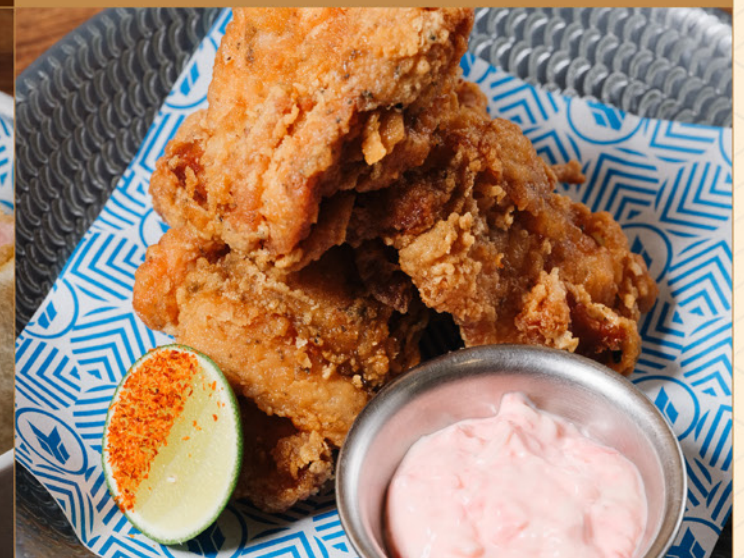
TORI KARAAGE 78 オリジナル / 葱だくごぼし / スパイシーマヨ Original / Negidaku / Spicy Mayo