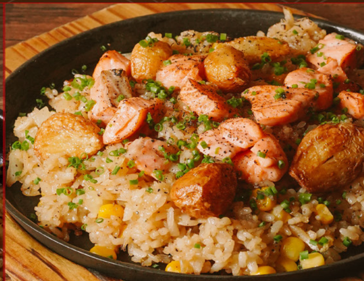
SALMON GARLIC PEPPER RICE 118 鉄板 サーモンガーリックペッパーライス Pepper Rice with Garlic & Salmon