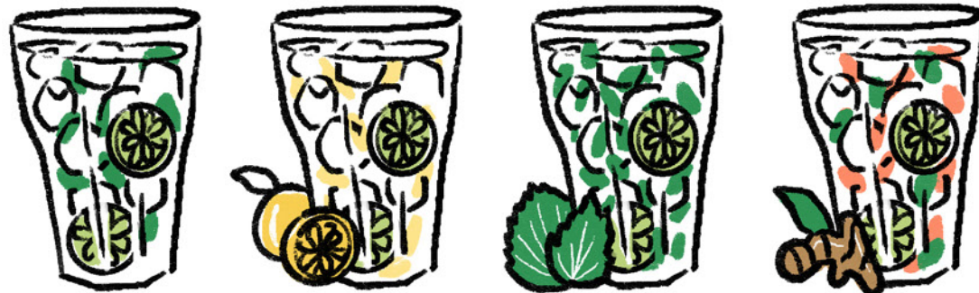
MOJITO 普通のモヒート 75