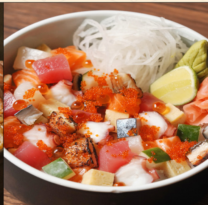
BARA CHIRASHI DON 138 ばらちらし丼 Mixed Diced Sashimi on Top of Rice