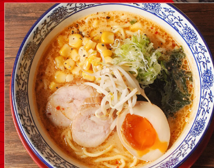
HOKKAIDO MISO BUTTER RAMEN 85 北海道みそバターラーメン Ramen with Thick Miso Soup, Chicken Chashu, Corn & Egg