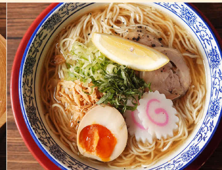
YUZU SHIO RAMEN 85 "元祖"ゆず塩ラーメン Ramen with Yuzu Clear Soup, Chicken Chashu & Egg