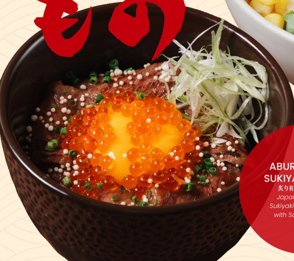
ABURI WAGYU SUKIYAKI DON 168 炙り和牛すき焼き丼 Japanese Wagyu Sukiyaki on top of Rice with Salmon Caviar