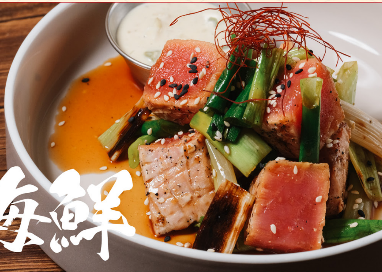
MAGURO STEAK WASABI TARTAR 118 まぐろステーキ ワサビタルタル Grilled Tuna Steak with Wasabi & Tartar