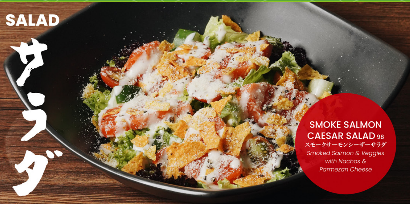
SMOKE SALMON CAESAR SALAD 98 スモークサーモンシーザーサラダ Smoked Salmon & Veggies with Nachos & Parmezan Cheese