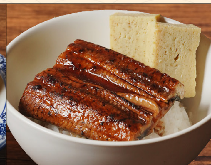
UNAGI DON 148 うなぎ丼 Grilled Unagi & Egg on top of Rice