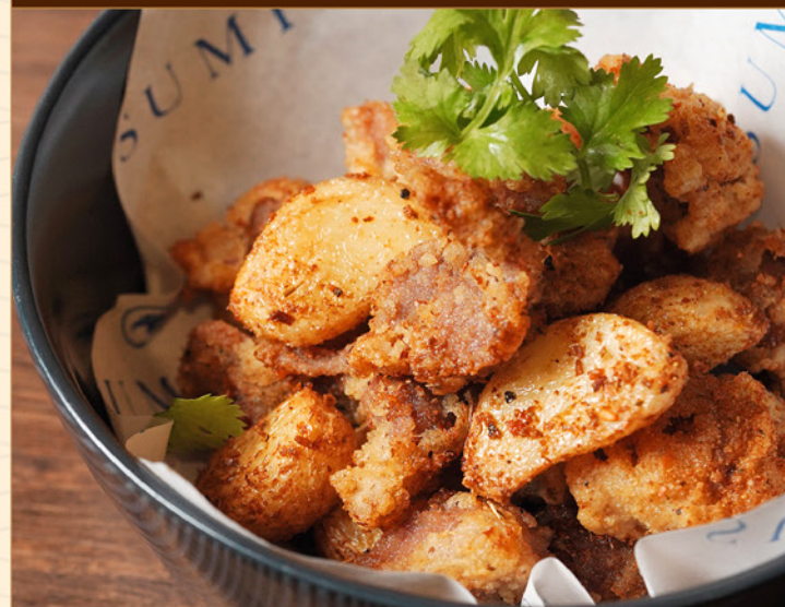
SUNAGIMO KOUMI AGE 68 コリコリ砂肝香味揚げ Fried Chicken Gizzard with Spicy Seasoning