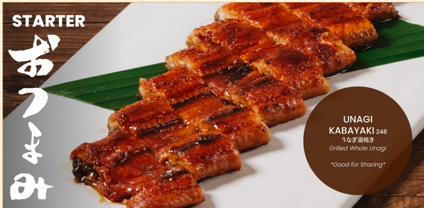
UNAGI KABAYAKI 248 うなぎ蒲焼き Grilled Whole Unagi *Good for Sharing*