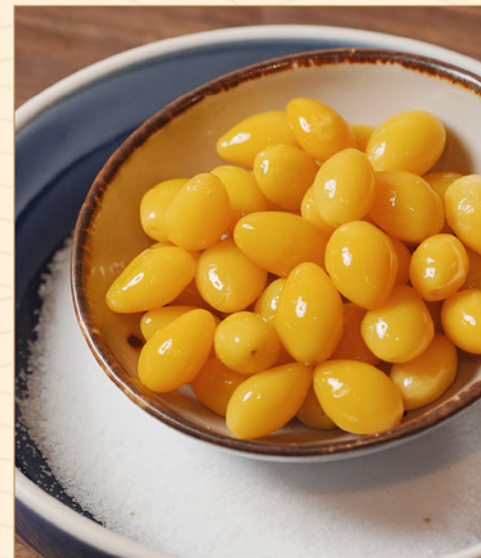
AGE GINNAN 78 揚げ銀杏 Ginkgo Nuts with Salt