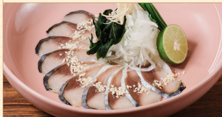
HAKATA GOMA SHIMESABA 88 博多風胡麻メサバ Marinated Mackerel with Sesame