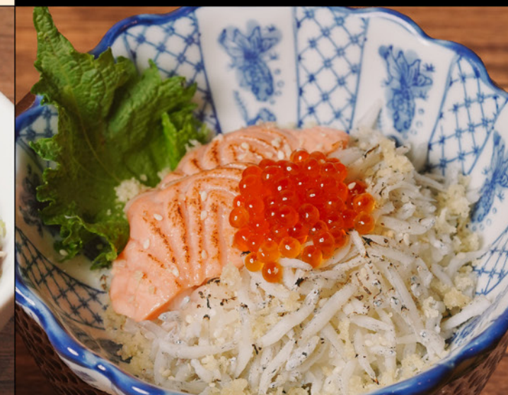
SHIRASU SALMON IKURA DON 98 釜揚げしらす サーモンいくら丼 小盛り Dried Fish, Salmon & Salmon Caviar on top of Rice