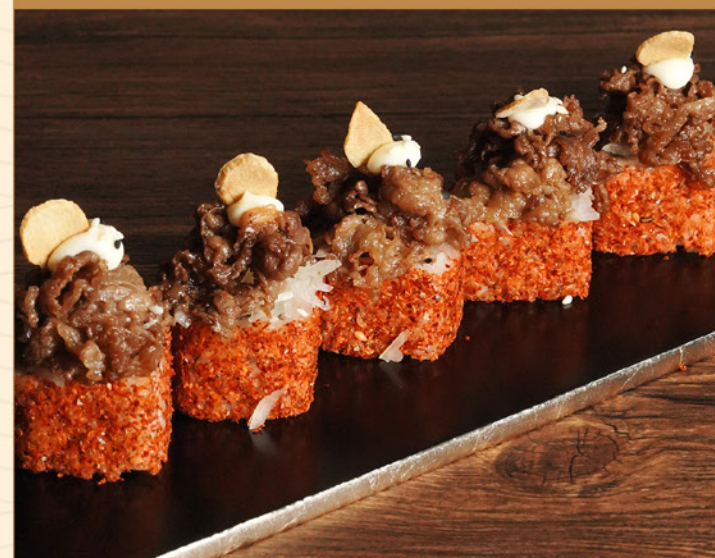
BEEF KIMCHI ROLL 95 牛キムチロール Sliced Beef Roll with Kimchi & Garlic