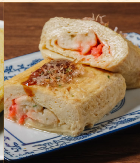
DASHIMAKI TAKOYAKI 78 出汁巻きたこ焼き Omelette with Octopus & Katsuoboshi