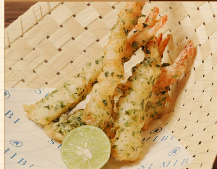
AONORI EBI TEMPURA 108 青のり海老天ぶら Deep-fried Prawn with Seaweed