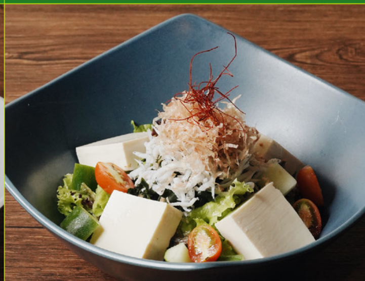
SHIRASU TOFU WAKAME SALAD 78 シラス豆腐若布サラダ Dried Whitebait Fish & Tofu with Veggies