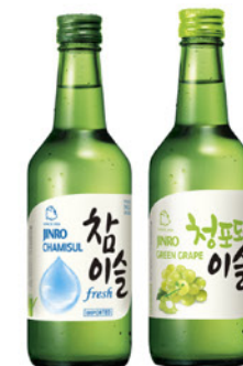
JINRO CHAMISUL ORIGINAL / GREEN GRAPE ジンロ チャミスル 180