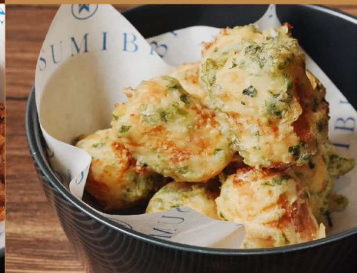
CHIKUWA CREAM CHEESE 58 ちくわクリームチーズ Deep-fried Fishcake with Cream Cheese Filling