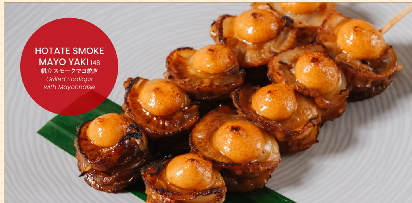
HOTATE SMOKE MAYO YAKI 148 帆立スモークマヨ焼き Grilled Scallops with Mayonnaise