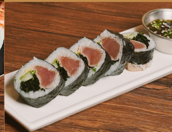
MAGURO TOSA ROLL 95 鮪の土佐ロール Tuna with Cucumber, Seaweed & Ponzu Dipping