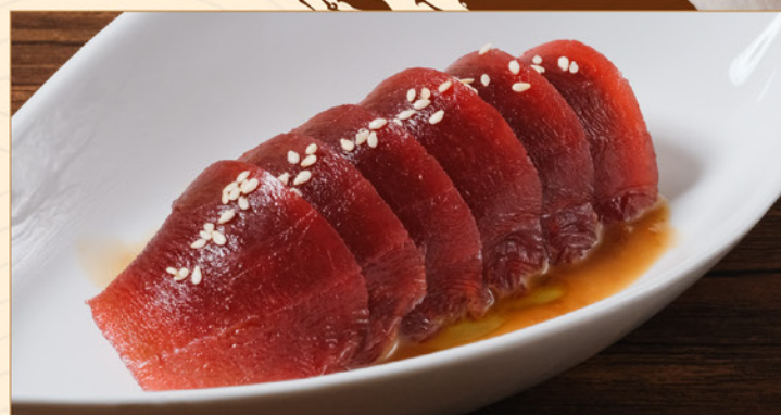
GOMA MAGURO 75 胡麻鮪 Fresh Tuna with Sesame Sauce