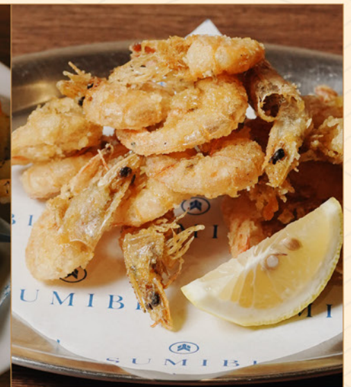
KOEBI KARAAGE 85 小海老店揚げ Deep-fried Shrimps