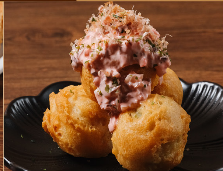
TAKOYAKI TEMPURA SHIBAZUKE TARTAR 68 たこ焼き天ぷら しぼ漬けタルタル Deep-fried Octopus Ball with Pickles Tartar